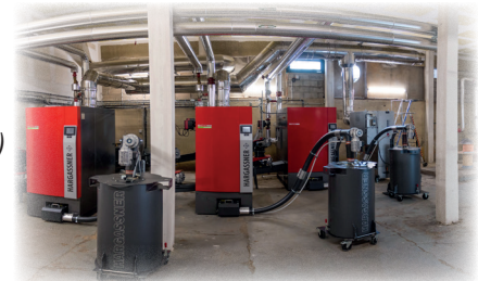
Trois chaudières Hargassner (2*220 kW et 1*330 kW) en cascade et leurs bacs à cendres

2 vis sans fin convoient le combustible depuis le silo, puis l'une alimente directement la chaudière 330 kW, quand l'autre amène le bois dans une auge de transfert desservant deux vis d'alimentation vers les chaudières de 220 kW.