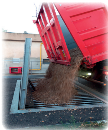
Livraison par bennage gravitaire direct