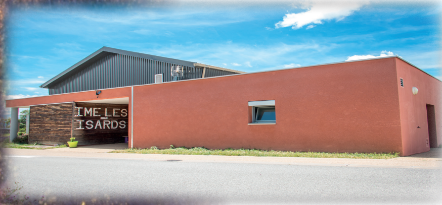
IME Les Isards