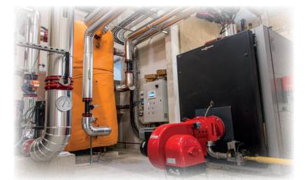
Ballon tampon de 5 000 L (en orange) et chaudière d'appoint-secours propane (en noir)