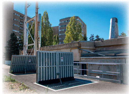
Les deux trappes carrossables du silo

Fournisseur : SARL Soulié - Jardinerie d'altitude