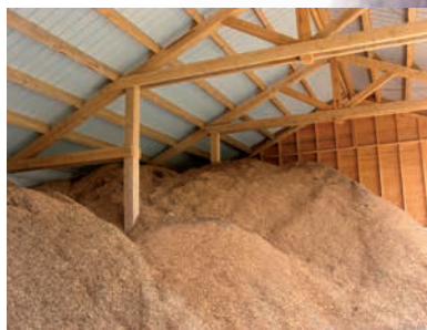
Intérieur hangar de stockage Osséja