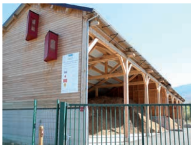
Hangar de stockage Osséja