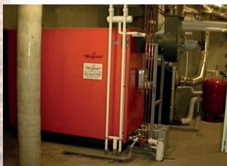
Chaudière Heizomat, 200 kW