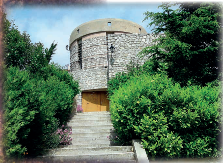
La Tour des Parfums, Mosset Conflent, Pyrénées-Orientales