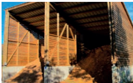
Hangar de stockage de plaquettes

Lieu de stockage : La Bastide Distance : 300 m Fournisseur : auto-approvisionnement Rythme d'approvisionnement : 1 fois par semaine soit 3.84 MAP par semaine