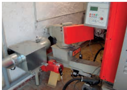
Local chaufferie et système de transfert des plaquettes

Consommation : 331 MAP à 25% HR / 88 Tonnes Energie produite / an 254 465 kWh énergie bois uniquement (Appoints décentralisés dans logements privés) Prix du kWh (ou de la tonne) : 0.032 € HT / kWh entrée chaufferie Quantité de cendres produites : 0.5 m