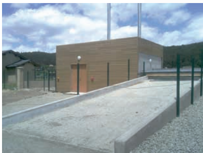
Local chaufferie et rampe d'accès au silo

Consommation : 394 MAP/an (prévisionnel) Energie consommée : 393 600 kWh/an Prix du kWh : 21€ HT/MAP 0,0204€ HT/kWh Quantité de cendres produites : non connu