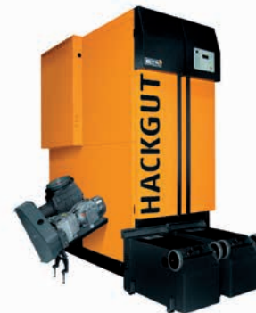
ETA HACK 200, 195 kW

Temps passé pour l'entretien 1,5h par semaine (Surveillance, nettoyage, évacuation bac à cendres, suivi administratif)