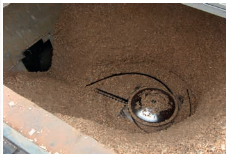
Extracteur rotatif à lames souples