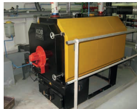
Chaudière Köb Pyrot, 220 kW