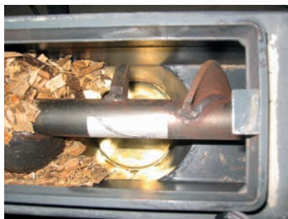
Vis sans fin