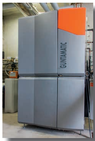
Chaudière Guntamatic, 75 kW