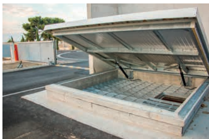
Capot du silo