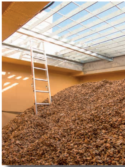
Silo enterré, 30 m 3