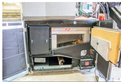
Foyer de la Chaudière