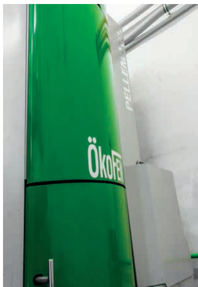
ÖkoFen, 56 kW