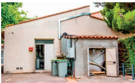
Local chaufferie et silo textile

Quantité de cendres produites / an : 30 litres